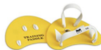
Plaquettes Doigts FINGER PADDLE 5€ 50