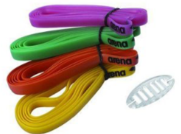
Elastiques de lunettes ARENA RACING GOGGLES SILICONE STRAP KIT