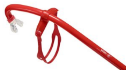
Tuba de Natation Frontal

Pas de matériel sophistiqué avec réservoirs et embouts fluos. La base : Ylon a : 18€ de toutes les couleurs !